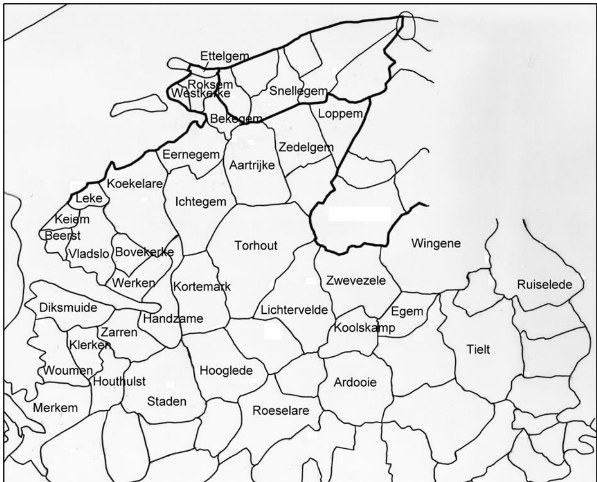
Kaart met de gemeenten uit de streek, waar de St Amandsabdij bezittingen had en invloed uitoefende. (Naar G. Berings)

of fiscus. De ligging, de enorme uitgestrektheid en de datum van schenking (zeer waarschijnlijk voor 822) zijn argumenten in die richting. Het gehele gebied zou kunnen in het bezit geweest zijn van de heren van Petegem of hun voorgangers.