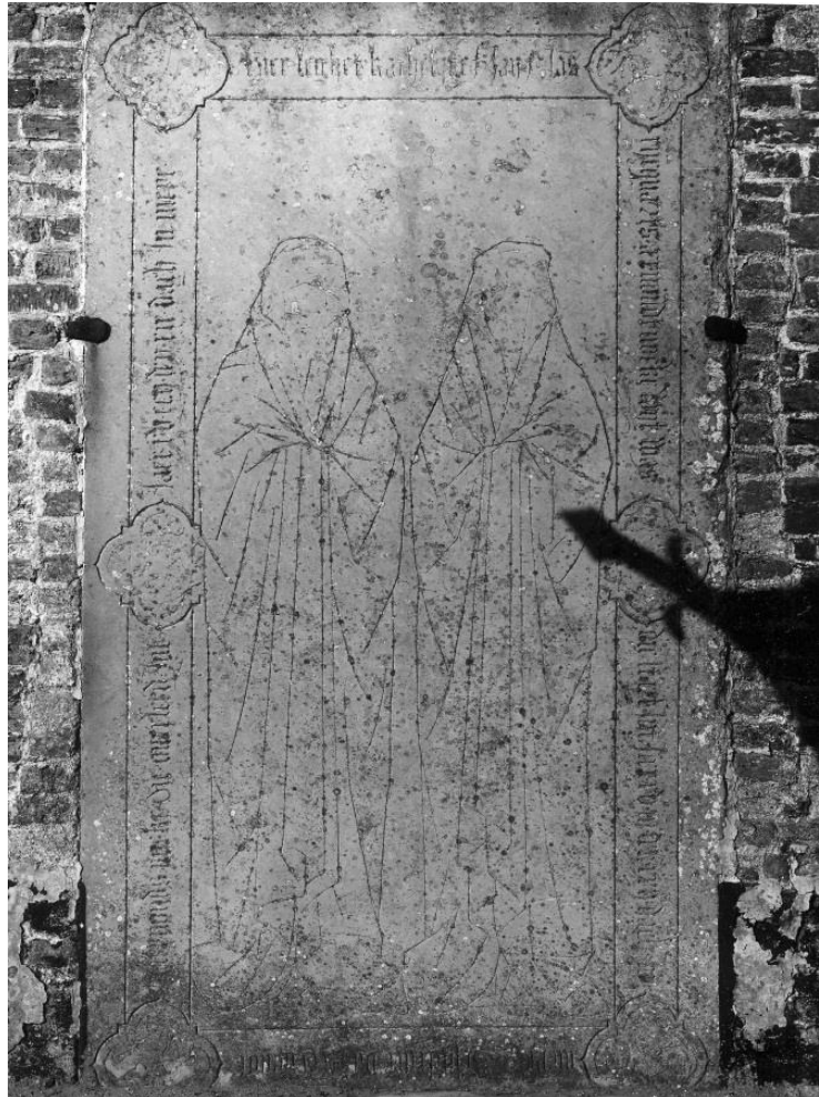
Fotorepertorium, 1977, p.15